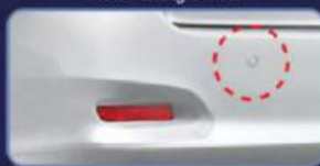
Meningkatkan faktor keamanan & memudahkan parkir mundur