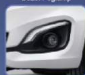
Tampilan lebih mewah