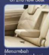
Menambah kenyamanan bagi penumpang baris ke 2