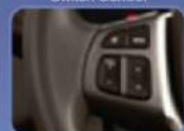
Memudahkan pengoperasian audio pada setir