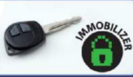
Kunci anti maling untuk mencegah pencurian