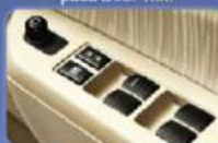
Tampilan yang elegan dan fungsional