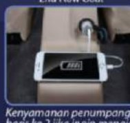
Kenyamanan penumpang baris ke 2 jika ingin menaruh HP