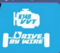
Mesin yang powerfull dengan akselerasi responsif, sehingga irit bahan bakar