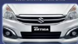
Menjadikan tampilan lebih stylish