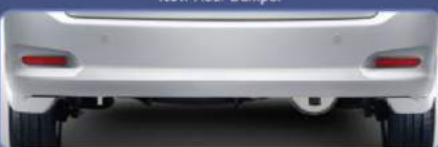
Tampilan lebih stylish