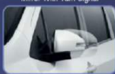
Tampilan lebih stylish. Memudahkan saat parkir dan melalui jalan sempit