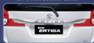
Tampilan lebih elegan dan mewah