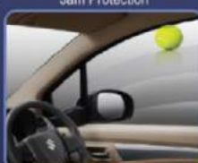
Menghindari terjepitnya tangan di jendela pengemudi