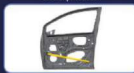
Memberikan perlindungan dari benturan samping