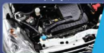
Mesin K14B yang ringan, VVT, MPI dan dilengkapi Drive by Wire

Menggunakan mesin K14B yang ringan dan bertenaga, Variable Valve Timing (VVT), Multi Point Injection (MPI), pedal gas berteknologi "Drive By Wire" serta inovasi pada mesin baru yang membuat Suzuki New Ertiga irit bahan bakar, namun bertenaga.