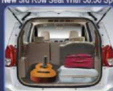
Membuat bagasi lebih luas dan memberi ruang untuk penumpang baris ke 3