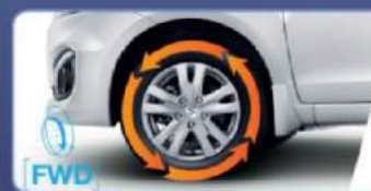
Penggerak roda depan, lebih irit, responsif dan tidak berisik