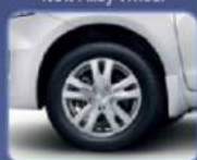
Tampilan lebih sporty