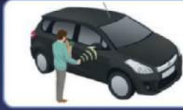
Immobilizer Key & Security Alarm