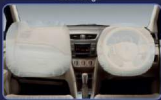
Memberi perlindungan dari benturan depan