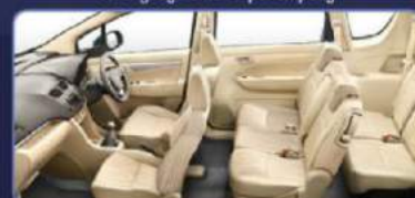
Ruang lega untuk 7 penumpang