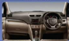
Warna baru pada setir, jok kursi, door trim dan gear shift memberi kesan mewah dan elegan, serta tidak mudah kotor