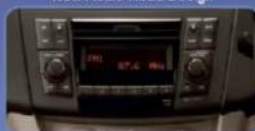
Tampilan lebih mewah