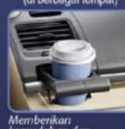
Memberikan kemudahan dan kenyamanan