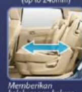
Memberikan keleluasan keluar masuk penumpang baris ke 3