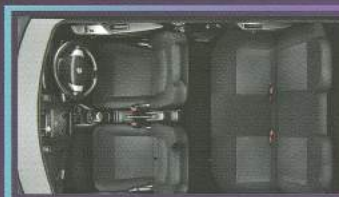
Spacious & Luxurious Cabin

Desain panel modern stylish dan penuh gaya