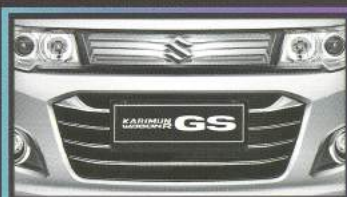
NEW! Front Grille

Desain impresif menambah penampilan lebih stylish