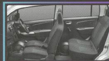
NEW! Black Fabric Seat

Menambah stabilitas berkendara di segala situasi