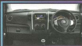
NEW! Black Dashboard

Interior lebih mewah dalam balutan warna hitam