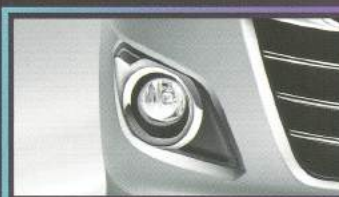
NEW! Fog Lamp