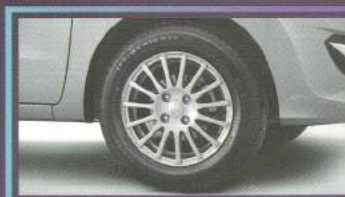
Velg 14" Alloy Wheel

Menambah stabilitas berkendara di segala situasi