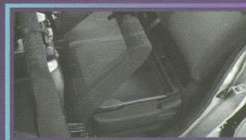
NEW! Black Under Seat Tray

Kompartemen rahasia untuk menyimpan barang berharga