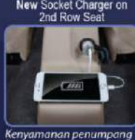
Kenyamanan penumpang baris ke 2 jika inain mena