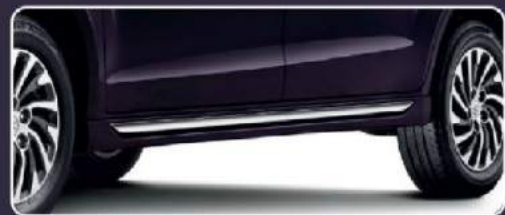
New Side Skirt Garnish Chrome

Membuat tampilan Elegant dan High Class serta performa mesin terjaga