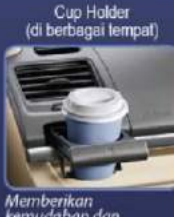
Memberikan kemudahan dan kenyamanan