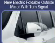
Tampilan lebih stylish. Memudahkan saat parkir dan melalui jalan sempit