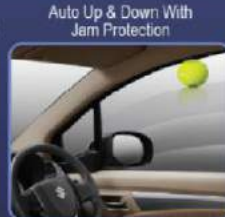
Menghindari terjepitnya tangan di jendela pengemudi