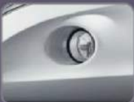
New Design Fog Lamp Bezel

Tampilan Elegant dan dapat meningkatkan keselamatan karena dilengkapi cahaya yang lebih terang