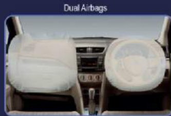
Memberi perlindungan dari benturan depan

Keamanan merupakan faktor penting dalam mobil keluarga. Suzuki New Ertiga dilengkapi dengan fitur-fitur keamanan dan keselamatan berstandar internasional.