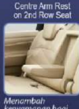
Menambah kenyamanan bagi penumpang baris ke 2