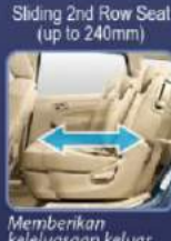
Memberikan keleluasaan keluar masuk penumpang baris ke 3