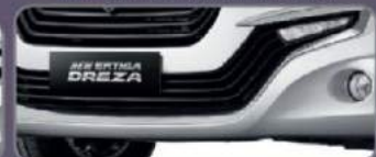
New Garnish Radiator Lower

Membuat tampilan beda dan High Class serta performa mesin terjaga