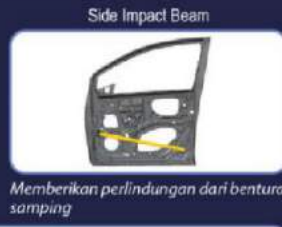
Memberikan perlindungan dari benturan samping