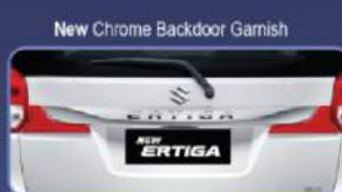
Tampilan lebih elegan dan mewah