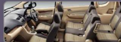
New Two Tone Color Pattern & Material Seat