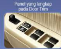
Tampilan yang elegan dan fungsional