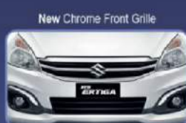
Menjadikan tampilan lebih stylish

Suzuki New Ertiga memberikan kemewahan mulai dari tampilan interior yang elegan dengan warna baru, fitur-fitur modern dan desain audio baru yang lebih mewah.