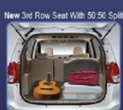
Membuat bagasi lebih luas dan memberi ruang untuk penumpang baris ke 3

Ruang yang luas, kursi yang tebal dan empuk, interior yang nyaman dan elegan membuat Suzuki New Ertiga benar-benar memanjakan Anda selama perjalanan.