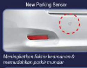
Meningkatkan faktor keamanan & memudahkan parkir mundur