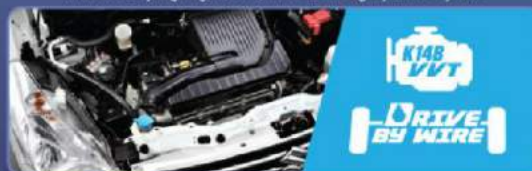
Mesin yang powerfull dengan akselerasi responsif, sehingga irit bahan bakar

Mesin K14B yang ringan, VVT, MPI dan dilengkapi Drive by Wire