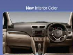
Warna baru pada setir, jok kursi, door trim dan gear shift memberi kesan mewah dan elegan, serta tidak mudah kotor