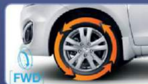
Penggerak roda depan, lebih irit, responsif dan tidak berisik