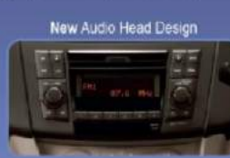
Tampilan lebih mewah