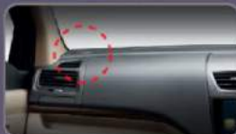
Tweeter on Dashboard

Meningkatkan keselamatan dengan tampilan yang beda dan High Class