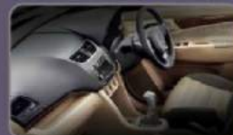
New Wood Panel Instrument & Door Trim (1 st Row)