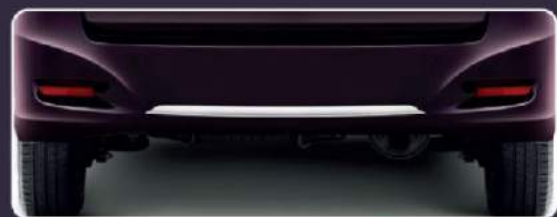
New Rear Bumper Garnish Chrome