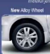
Tampilan lebih sporty