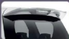
New Rear Upper Spoiler

Meningkatkan keselamatan dengan tampilan yang beda dan High Class