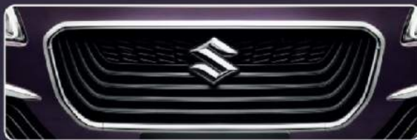
New Grille Radiator Upper with Ring Chrome Garnish

Membuat tampilan Elegant dan High Class serta performa mesin terjaga