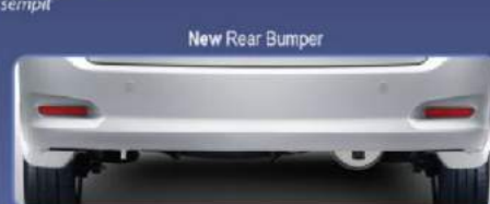
Tampilan lebih stylish