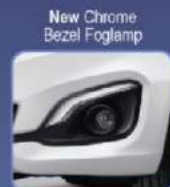
Tampilan lebih mewah