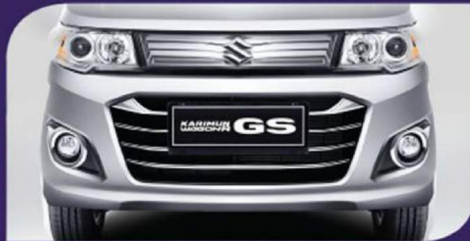
NEW! Front Grille, Headlamp, Fog lamp