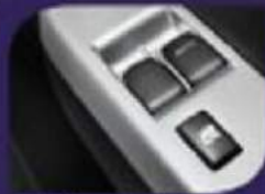
Power Window (DL & GS)