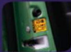
Child Proof Door Lock