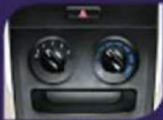
Air Conditioner (Semua Tipe)