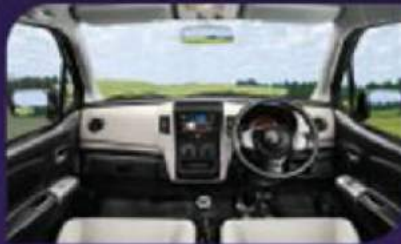
Kabin luas dengan dashboard yang modern