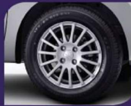
14" Alloy Wheel