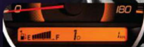
Pengoperasian Automatic pada gigi 1