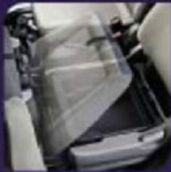
Under Seat Tray (khusus GS)