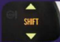
Gear Shift Indicator (Semua Tipe)